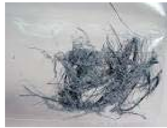
Crocidoliet asbest ( in volksmond blauwe asbest ) Blauw, naaldvormig, stekelig, Zeer gevaarlijk bij inademing