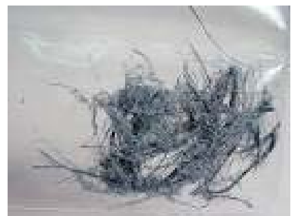
Crocidoliet asbest ( in volksmond blauwe asbest ) Blauw, naaldvormig, stekelig, Zeer gevaarlijk bij inademing