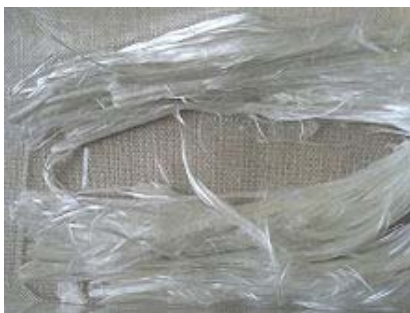
Chrysotiel asbest ( in volksmond witte asbest ) Wit, zacht, serpentijn vorm Gevaarlijk bij inademing

NAF = afkorting No Asbestos Found NAF interpretatie = No asbestos found = ( geen asbest gevonden ) betekent dat de aanwezigheid van asbest kon niet worden aangetoond met de gebruikte techniek optische microscopie, polarisatie en dispersiekleuring.